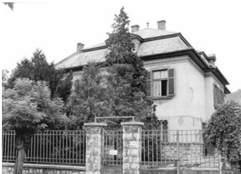
Az Esztergomi Eggenhofer-villa