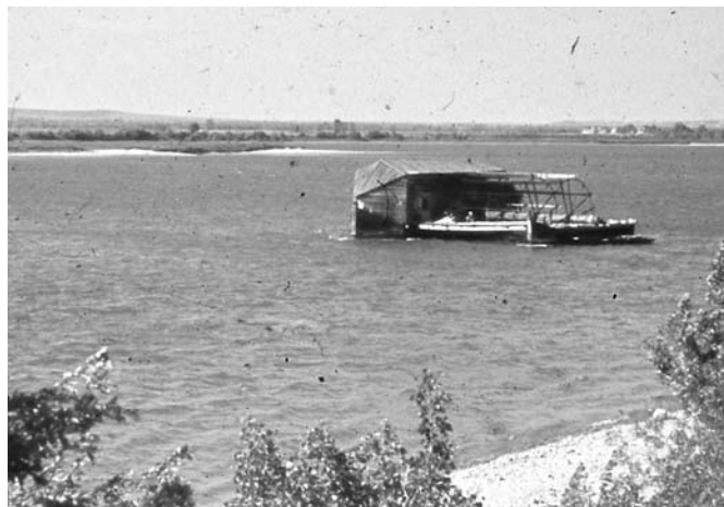
3. kép: Hajómalom 1943-ban Süttőnél (a háttérben, a hajómalomtól balra látszik a süttői zátony/sziget). A fotót Konok Tamás őrnagy, a 2. Magyar Hadsereg haditudósító századának parancsnoka készítette (forrás: FORTEPAN).

A 3. kép (eredetileg színes!) felvételén láthatjuk, hogy vidékünkön az uralkodó nyugati-északnyugati szélirány miatt a házhajó erős burkolattal rendelkezik.