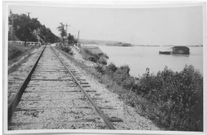
2. kép: Hajómalom a kisállomásnál

(1869-1887) idején 5 hajómalom számolható a sziget/zátony és a süttői part között. Barakka Gábor kiváló könyvéből (Sédttől-Süttőig) tudhatjuk, hogy a két világháború között is működött hajómalom a „kisállomásnál”, és erről a IV. katonai felmérés (1941) térképe mellett a mellékelt fotók is tanúskodnak.