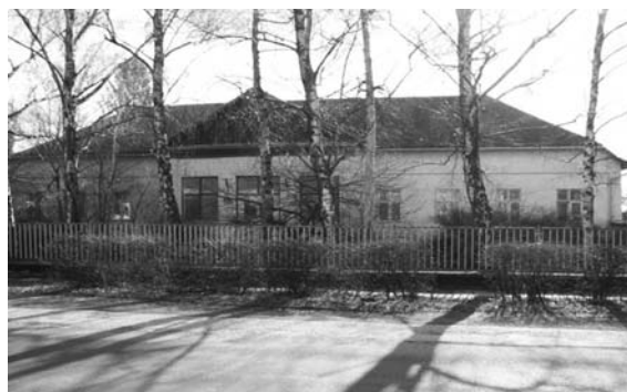
A táti Eggenhofer-kúria: kisajátítás 1952-1953 községháza, 1982-ig nagyközségi tanács. 1990-től rehabilitációs foglalkoztató, gépkatrészek összeszerelő műhelye. Jelenleg üresen áll.