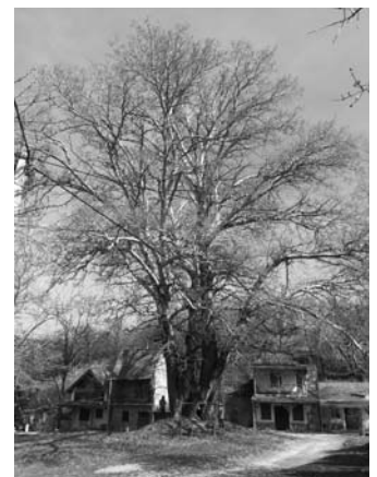
Szürkenyár a Nussgromban