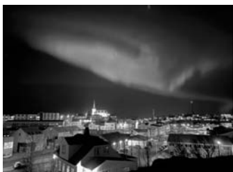
Borgarnes-i est, a szobám ablakából februárban (Az északi fény az egyik legcsodálatosabb látvány)