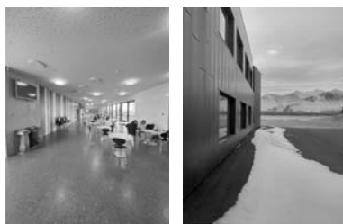
Menntaskóli Borgarfjardar - Borgarnes, Nyugati-Föld