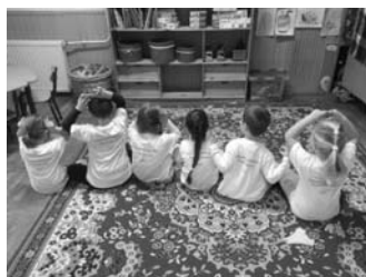
A Mikulás apót már ünnepi Százsorszép pólóban várjuk!

Mihály-napi vásárunk 2. éve szerveztük meg sikerrel! A pénzt a játszóudvarunk fejlesztésére gyűjtögetjük! Vásárunk fő portékája a Százsorszép póló volt, amely váratott magára, de megérte!